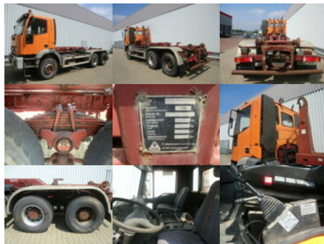
Iveco Trakker 320 E34 6x460EH 34 6x4 Trakker 320 E34 6x460EH 34 6x4, Ersatzteilträger

Preis (brutto): 16.541,00 € Gesetzl. MwSt. 19%: 2.641,00 €