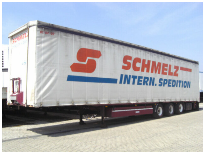
Meusburger SANh MPS-3 MEUSBURGER MPS-3, Mega, Jumbo

Preis (brutto): 3.451,00 € Gesetzl. MwSt. 19%: 551,00 €