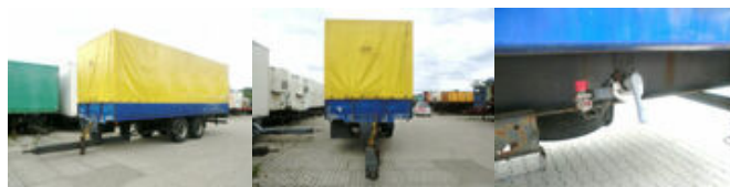
Zanner TPA 18 Zanner TPA 18

Preis (brutto): 3.451,00 € Gesetzl. MwSt. 19%: 551,00 €