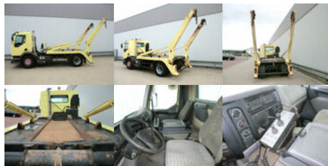
Renault Premium 250 4x2

Preis (brutto): 10.591,00 € Gesetzl. MwSt. 19%: 1.691,00 €