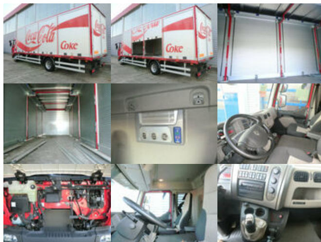
Renault Midlum 220 DXi 4x2 Midlum 220 DXi 4x2 Getränkekofer TÜV:2019

Preis (brutto): 34.391,00 € Gesetzl. MwSt. 19%: 5.491,00 €