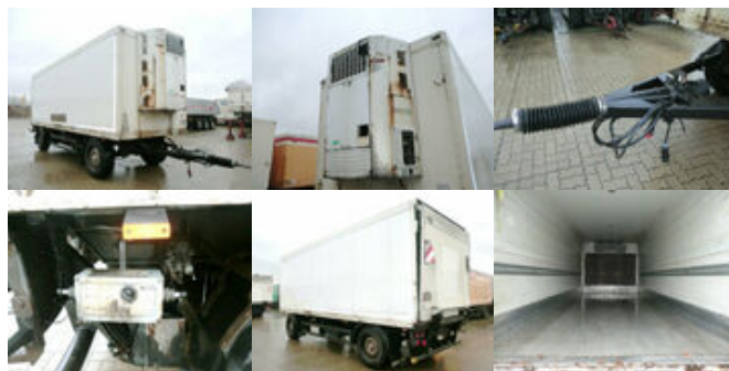
Schmitz KO 18 KO 18, 2x VORHANDEN!

Preis (brutto): 4.641,00 € Gesetzl. MwSt. 19%: 741,00 €