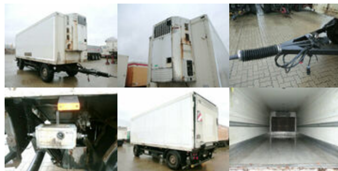
Schmitz KO 18 KO 18, 2x VORHANDEN!

Preis (brutto): 4.641,00 € Gesetzl. MwSt. 19%: 741,00 €