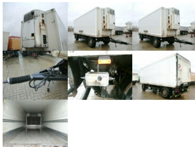
Schmitz KO 18

Preis (brutto): 4.641,00 € Gesetzl. MwSt. 19%: 741,00 €