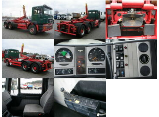
MAN E69 26.403 26.403 6x2, Marrell 26.70, AHK

Preis (brutto): 14.161,00 € Gesetzl. MwSt. 19%: 2.261,00 €