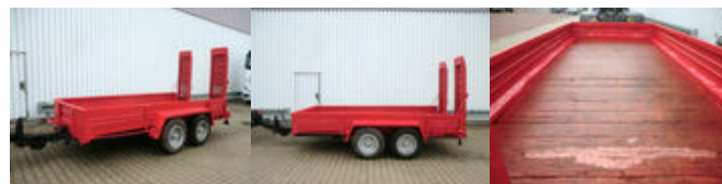
Fuchs TP 4000 FUCHS, HEINRICH TG 4000

Preis (brutto): 3.451,00 € Gesetzl. MwSt. 19%: 551,00 €