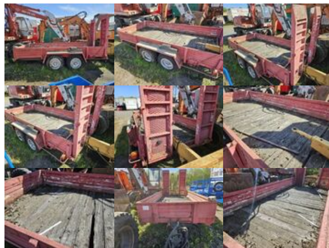
Fuchs TP 4000 FUCHS, HEINRICH TG 4000

Preis (brutto): 3.451,00 € Gesetzl. MwSt. 19%: 551,00 €