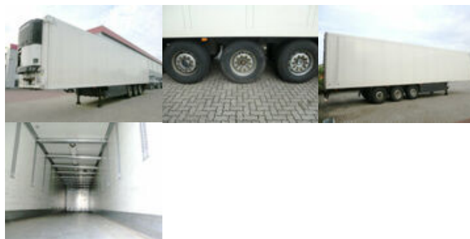
Schmitz SKO 24

Preis (brutto): 9.401,00 € Gesetzl. MwSt. 19%: 1.501,00 €