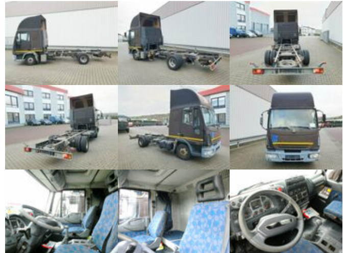
Iveco EuroCargo 75 E 17/4x2 EuroCargo 75 E 17/4x2, 6x VORHANDEN!

Preis (brutto): 5.831,00 € Gesetzl. MwSt. 19%: 931,00 €