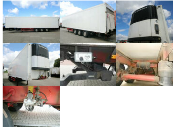
Schmitz SKO 24 Sko 24

Preis (brutto): 5.831,00 € Gesetzl. MwSt. 19%: 931,00 €