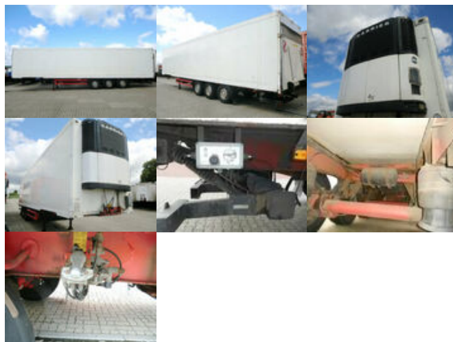
Schmitz SKO 24 Sko 24

Preis (brutto): 5.831,00 € Gesetzl. MwSt. 19%: 931,00 €