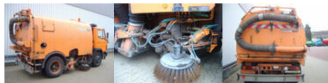
Mercedes-Benz L 1314KO 4x2

Preis (brutto): 5.831,00 € Gesetzl. MwSt. 19%: 931,00 €