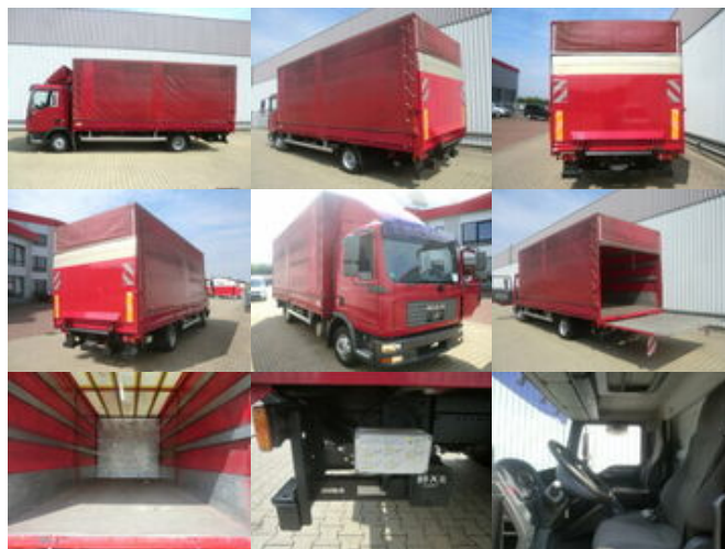
MAN TGL 8.210 BL 4x2

Preis (brutto): 8.211,00 € Gesetzl. MwSt. 19%: 1.311,00 €