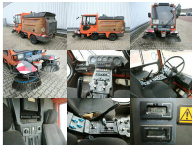
Schmidt - SK153SX

Preis (brutto): 8.211,00 € Gesetzl. MwSt. 19%: 1.311,00 €