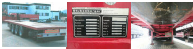
TONHOFER SAh DL 1 TONHOFER DL1 Plattform-Auflieger

Preis (brutto): 4.641,00 € Gesetzl. MwSt. 19%: 741,00 €