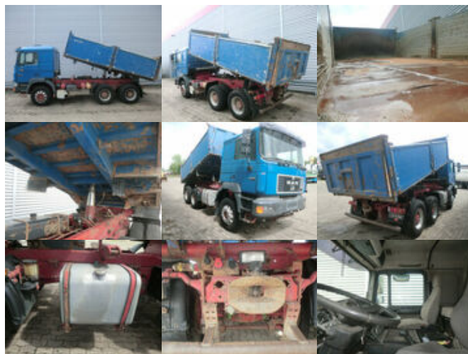
MAN T39 26.403 6x4