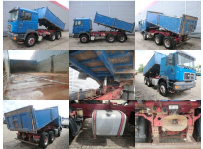
MAN T39 26.403 6x4 T39 26.403 6x4

Engine repaired for approx. EUR 10,000, new pistons