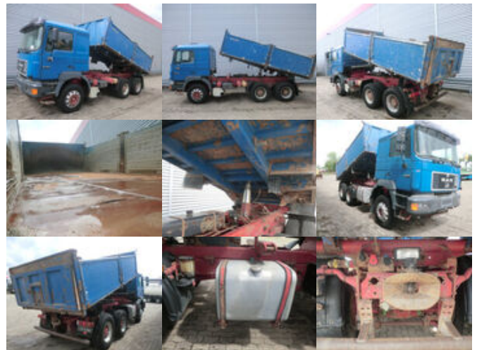
MAN T39 26.403 6x4 T39 26.403 6x4

Engine repaired for approx. EUR 10,000, new pistons