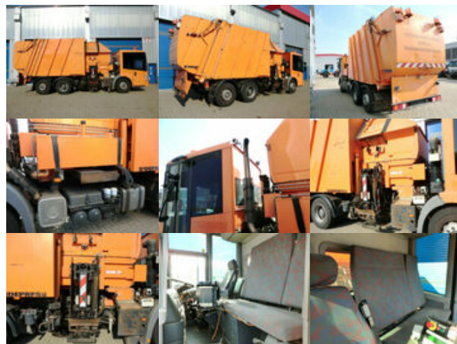
Mercedes-Benz Econic 2628L 6x2 mit SIDEPRESS Aufbau Econic 2628L 6x2 mit SIDEPRESS Aufbau

Preis (brutto): 9.401,00 € Gesetzl. MwSt. 19%: 1.501,00 €